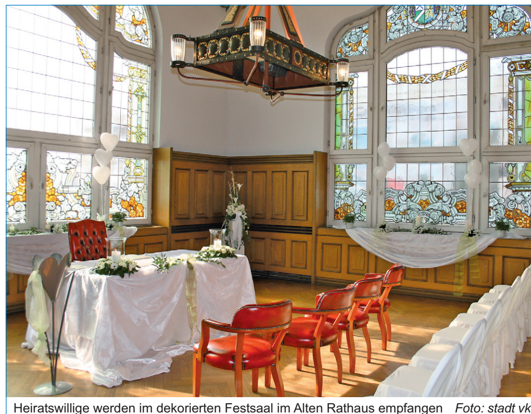
Heiratswillige werden im dekorierten Festsaal im Alten Rathaus empfangen

Passend zur Jahreszeit werden der Festsaal aber auch der Vorraum und der Eingangsbereich mit verschiedenen Blumenarrangements dekoriert, dabei dominieren die Farben weiß und grün. Um auch musikalisch für die richtige Stimmung zu sorgen, werden die Trauungen live mit romantischer Musik am Klavier begleitet. Anmeldungen oder Reservierungen werden ab sofort entgegengenommen. Heiratswillige Paare sollten sich aber schnell entscheiden, da nur noch wenige Termine frei sind.