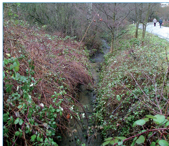
Blick auf den Eberbach

Die Planung und Durchführung der Ersatzmaßnahmen erfolgt durch die RAG Montan Immobilien GmbH im Auftrag des Wasser- und Schifffahrtsamtes Saarbrücken, das als Träger der Maßnahmen die Kosten übernimmt. Die Planungen wurden mit der Stadt Völklingen abgestimmt und durch das Landesamt für Umwelt und Arbeitsschutz genehmigt. Im Rosseltal bei Geislautern